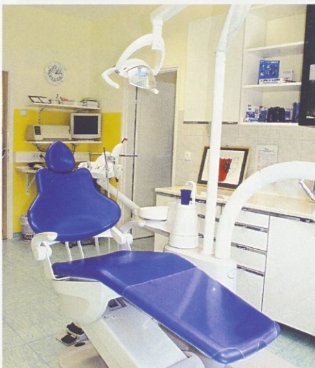
Ali bo novi stol privabil stalnega zobozdravnika?