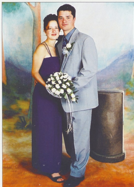
Kokot - Borak