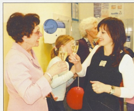
Na zdravje, ob novi pridobitvi.