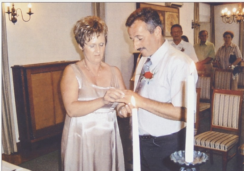
Kralj - Meglič

zdravi v prijetnem in zdravem okolju v katerem koli kotičku naše občine Zavrch.