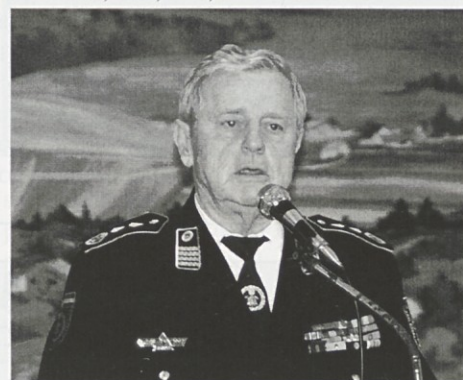
V Lovrečanu je aktualno problematiko v hrvaškem gasilstvu slikovito opisal predstavnik hrvaške gasilske zveze

Izobraževalo se je kar 18 članov, kar je za manjše društvo na širšem Ptujskem velik uspeh, danes pa se v PGD Zavrč lahko