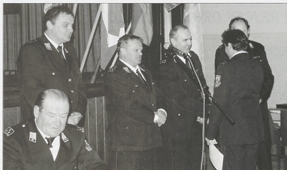
Na občnem zboru so podelili tudi priznanja in potrdila o opravljenih napredovanjih.